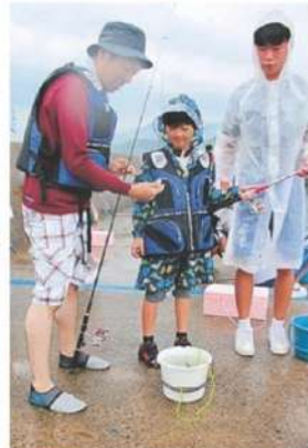
街親子で協力して楽しい釣り。形のいいキジハタも上がった(写真は、いずれも14日、宮津市)