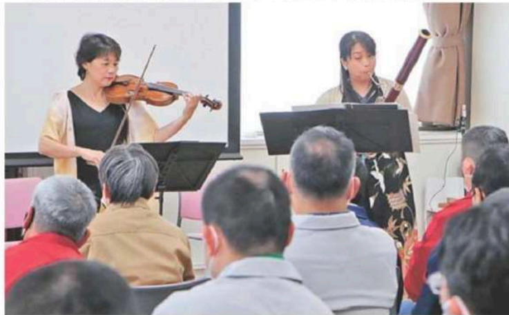
利用者を楽しませたバイオリンとファゴットの奏者2人による演奏会（守山市十二里町、もりやま作業所）