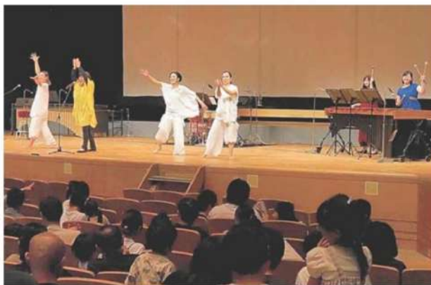
会場とパフォーマンスで盛り上がったコンサート (守山市三宅町・守山市民ホール)

京滋の交通遺児に「卒業お祝い」として、図書カードを小学生7人（1人5千円分）、中学生9人（同7千円分）、高校生11人（同1万円分）の計27人に京都府や京都市、おりづる会（滋賀県）を通じて届けた。交通遺児のために寄せられた寄付を活用している。