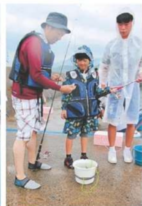
親子で協力して楽しい釣り。形のいいキジハタも上がった(写真は、いずれも14日、宮津市)