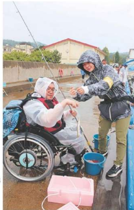
雨の中で車いす参加者もチャレンジ。カマスを釣り上げた

主な協力団体は次の通り。 【後援】京都府、宮津市、宮津市社会福祉協議会、KRS京都 【協力】日本釣振興会近畿地区支部・京都府支部、全日本釣り団体協議会、京都府磯釣連合会、MFG、GFG、京都府漁業協同組合、訪問看護ステーションふおすたあ伏見 【協賛】アサヒフーズ、がまかつ、東レ・モノフィラメント、ハヤブサ、マルキュー、マルゲ